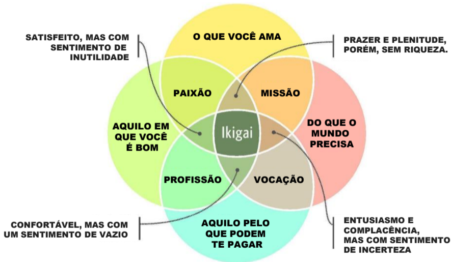
DIAGRAMA DE MARC WINN